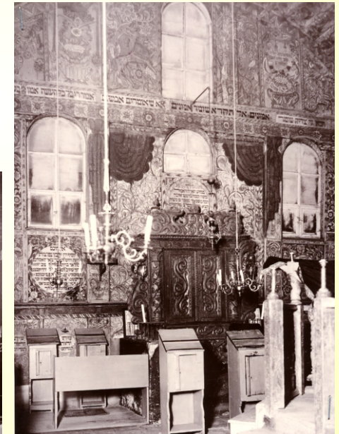
Ostwand der Synagoge, barocker Schrank, genannt "Heilige Lade", ewiges Licht; Aufbewahrung der Schriftrollen.