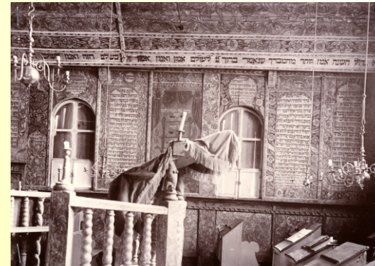
Nordwand der Synagoge, Almemor, Tisch des Tempels